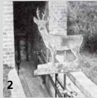
01 Hess, Victor Franz, Prof. Österreichischer Physiker