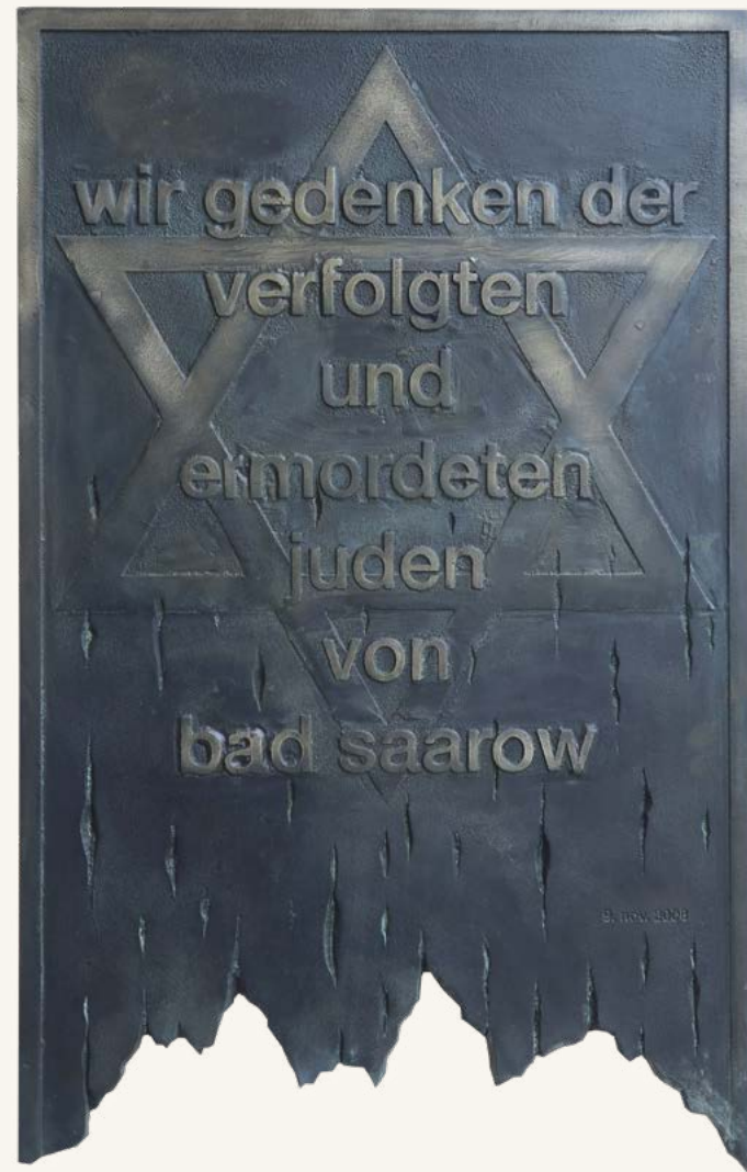
Gedenktafel am Bahnhof Bad Saarow nach einem Entwurf von Morton Ehdin

Hinweise und Fragen nimmt die Gruppe „Initiative Jüdische Spuren in Bad Saarow“ gern entgegen. E-Mail: info@foerderverein-bad-saarow.de